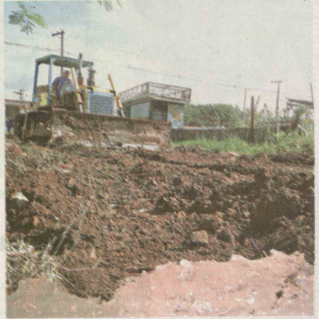
Caminhões poderão utilizar o local antes do término das obras

A realização do aterro foi anunciada pela prefeita a um grupo de caminhoneiros ontem. Eles